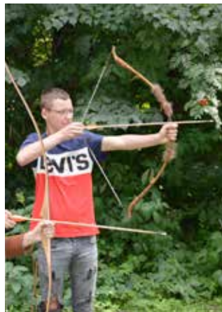
Noyellois en Pologne