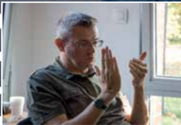
Eveil et découvertes au multi-accueil l'Orée du Jour