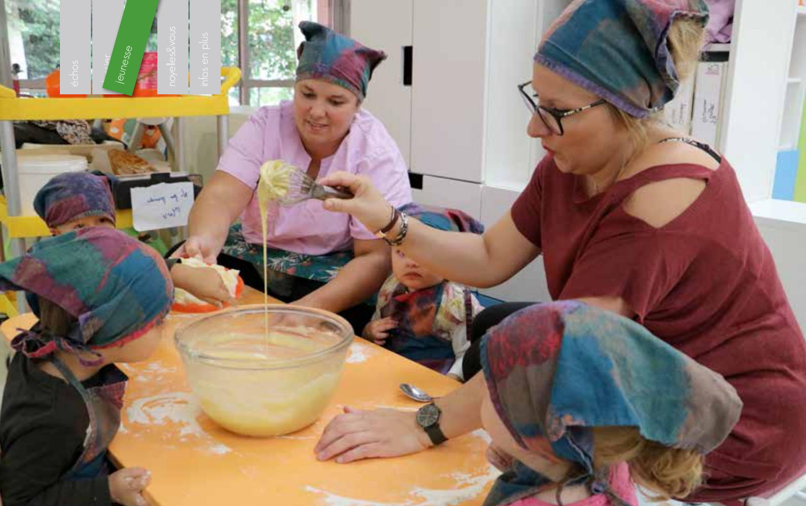
Atelier cuisine au multi-accueil l'Orée du Jour