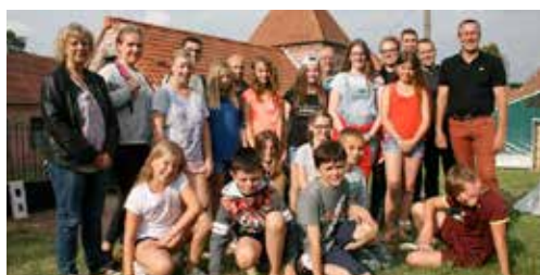
Camping à Bajus