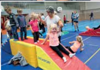
Faites du sport à Noyelles !