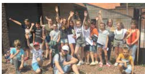
Sortie au poneys-club