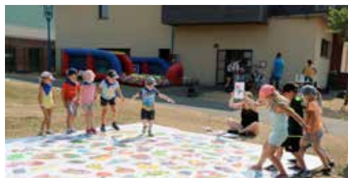
Intercentre avec l'ALSH d'Annequin