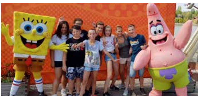
Noyellois en visite en Allemagne