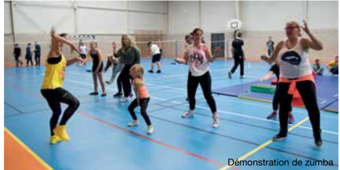
Démonstration de zumba

Rendez-vous est pris pour l'année prochaine pour une 10 ème édition qui réservera à coup sûr de nombreuses surprises !