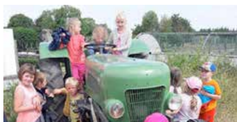
Ferme Camelus à Bray-Dunes