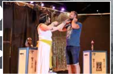
14 juillet, le centre du village en fête