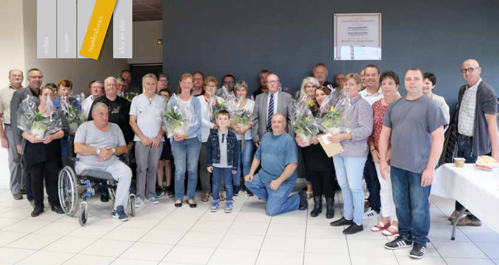
Participants au concours des maisons fleuries