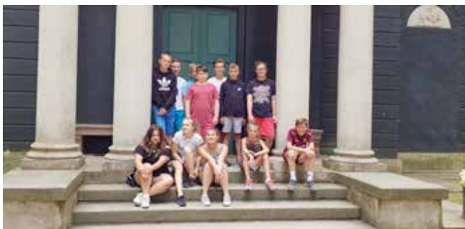
Noyellois en Allemagne

de Jumelage a à cœur de faire découvrir notre ville et de proposer aux jeunes noyellois d'aller à la rencontre d'autres populations, d'autres lieux, d'autres cultures qui ont une histoire avec Noyelles-les-Vermelles.