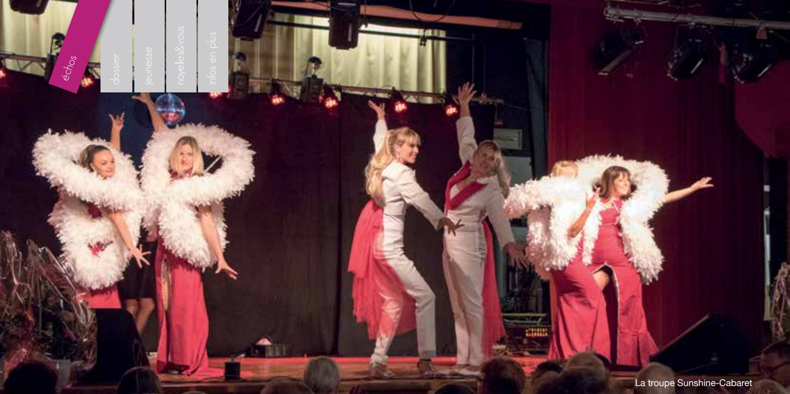
La troupe Sunshine-Cabaret