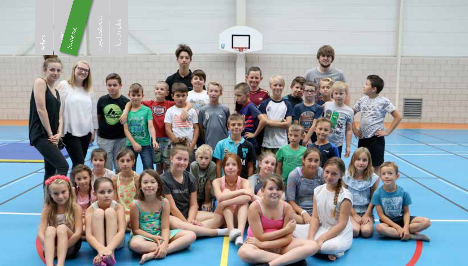
Accrogym, pour le groupe des 8-11 ans