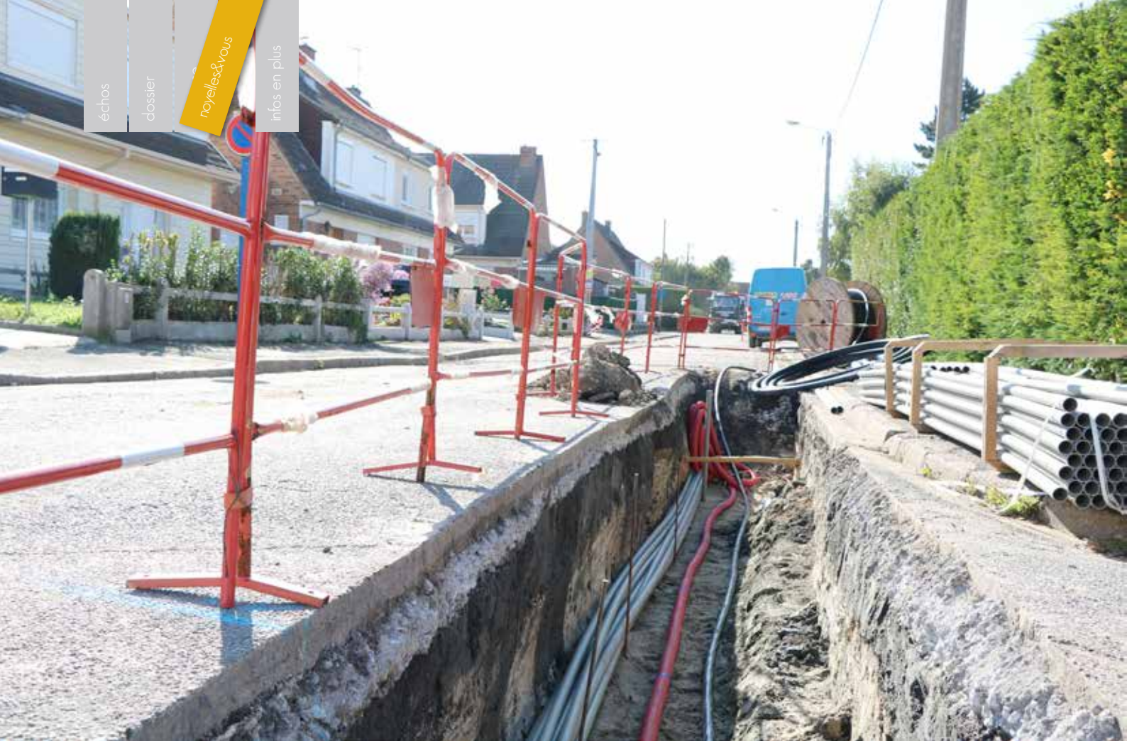
Rue des Pinsons