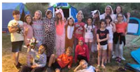
Camping à Merlimont