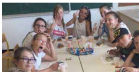
Goûter des grands