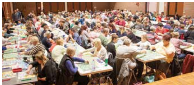
01/11 Loto de l'Amicale des Sapeurs Pompiers