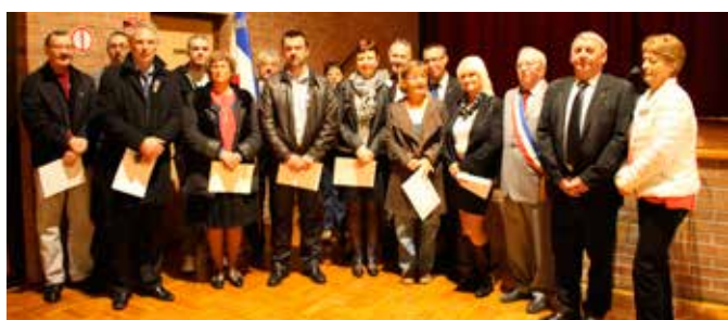
23/10 Remises de médailles aux Médaillés du travail