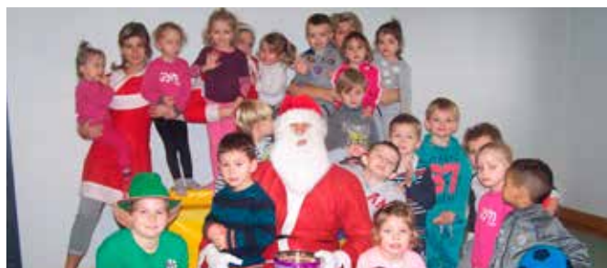
10/12 Noël de la baby-gym par la MJC