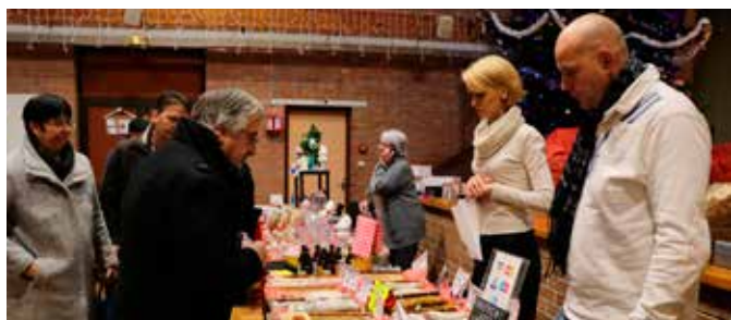
04/12 Marché de Noël et bourse aux jouets par la MJC