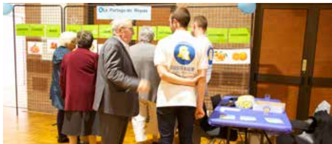
03/10 Semaine Bleue avec le CIASFPA