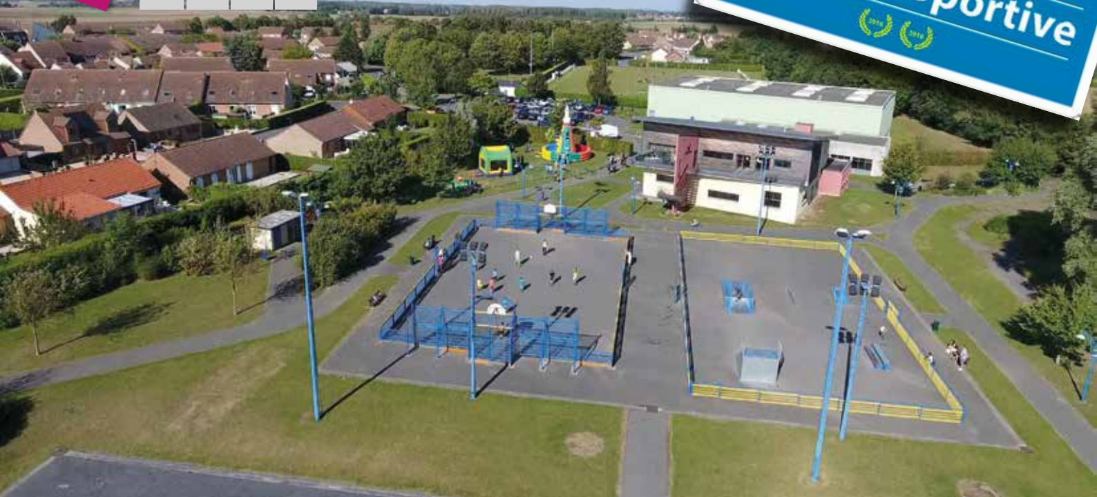
Complexe ludique et sportif, photo prise par drone.