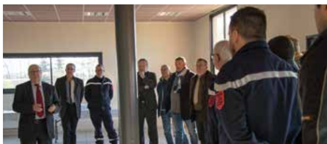
04/12 Cérémonie de la Sainte Barbe