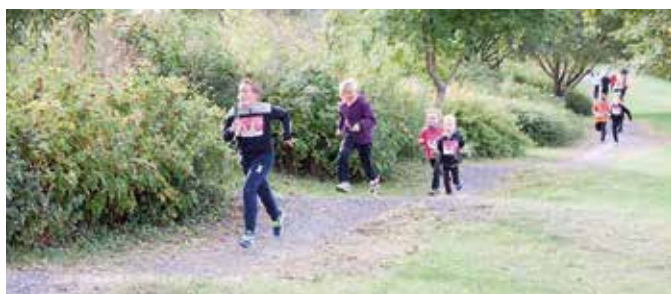
10/10 Les enfants de l'école Pierre Baudel courent pour l'association ELA