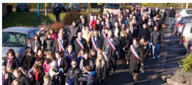
11/11 Commémoration suivie du banquet des Anciens Combattants