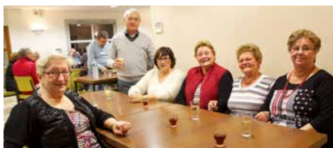
17/11 Repas Beaujolais du Club des aînés