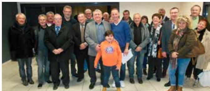
02/12 Remise de dons à l'association Idées Chouettes par l'association des Médailleurs du Travail