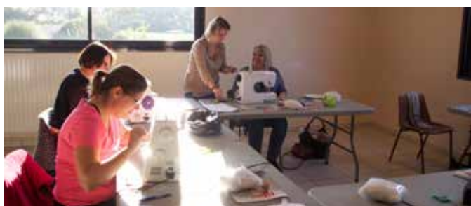
15/10 Atelier couture avec la MJC