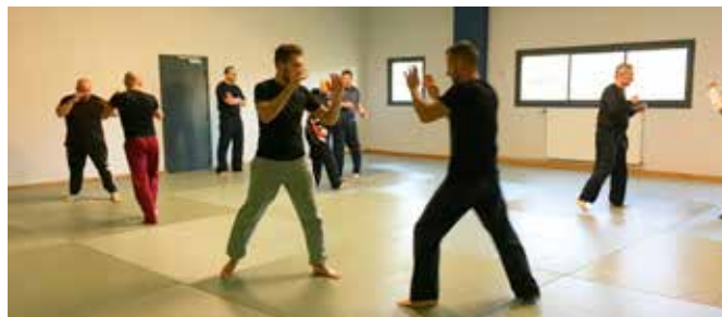
05/12 Initiation au krav-maga par l'association All in Move à l'occasion du Téléthon