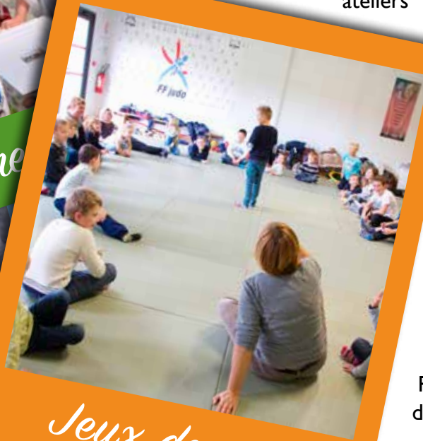
Jeux de rôle