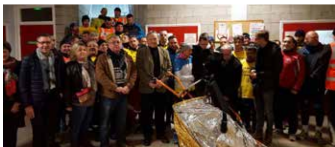
03/12 Accueil du marathon des pompiers à l'occasion du Téléthon