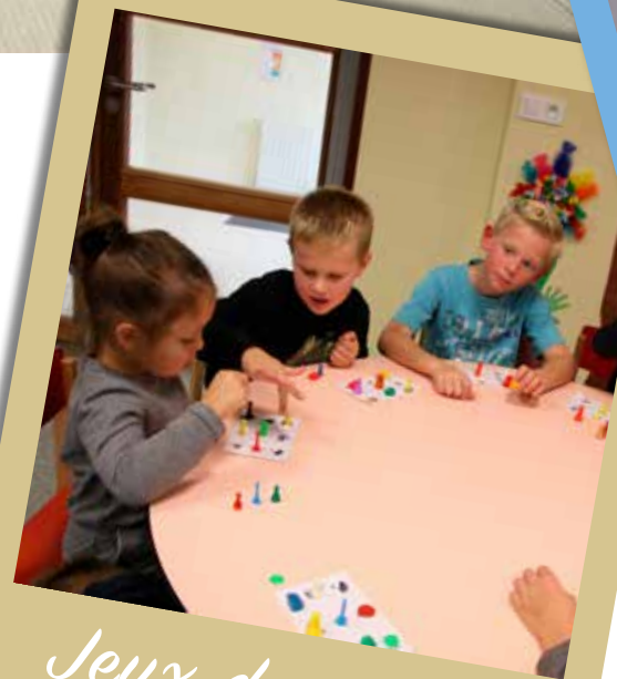
Jeux de société

L'équipe d'animation propose de nombreuses activités manuelles, sportives et de loisirs adaptées à l'âge des enfants. Des sorties sont régulièrement organisées. C'est un moment convivial de détente et de loisirs pour les enfants.