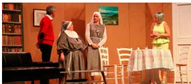
04/11 Représentations de théâtre par Variations