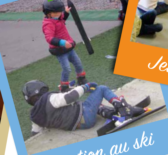
Initiation au ski