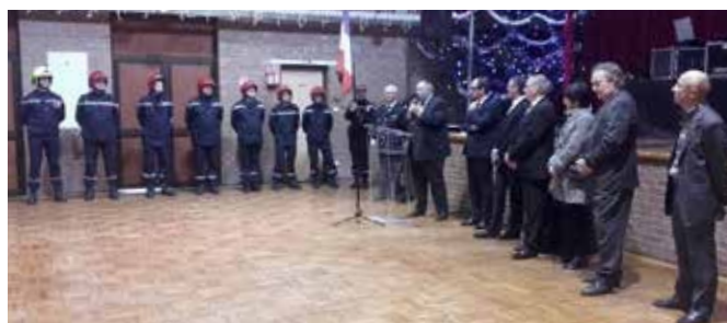
11/12 Banquet des pompiers