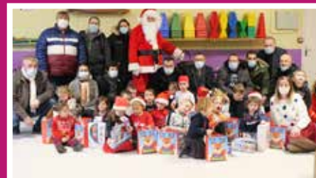
CLASSES DE MATERNELLE DE L'ÉCOLE PIERRE BAUDEL