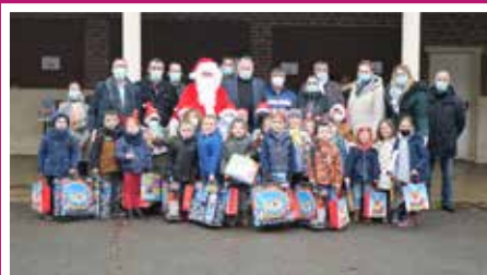
CLASSES DE PRIMAIRE DE L'ÉCOLE PIERRE BAUDEL